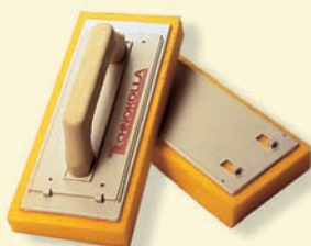
TKW 481 Szivacs