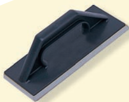
TKW 452 Mousse lehúzó