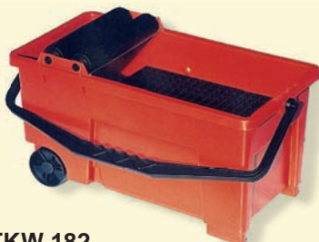
TKW 182 Tisztító vödör